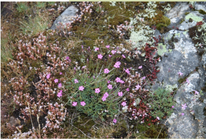
Caravel de monte ( Dianthus laricifolius )