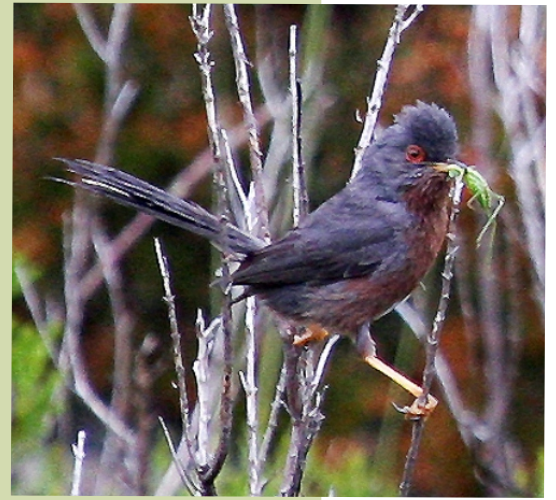
Papuxa montesa ( Sylvia undata ), un pequeno paxaro habitual dos matos de breixos.