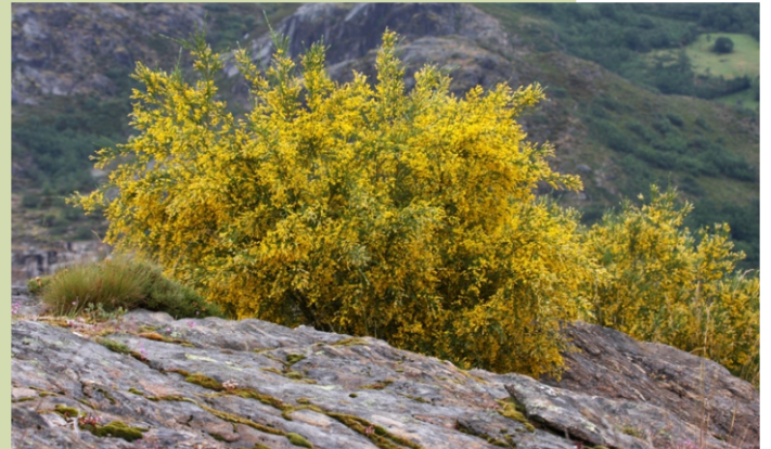
Xesta ( Cytisus oromediterraneus ).