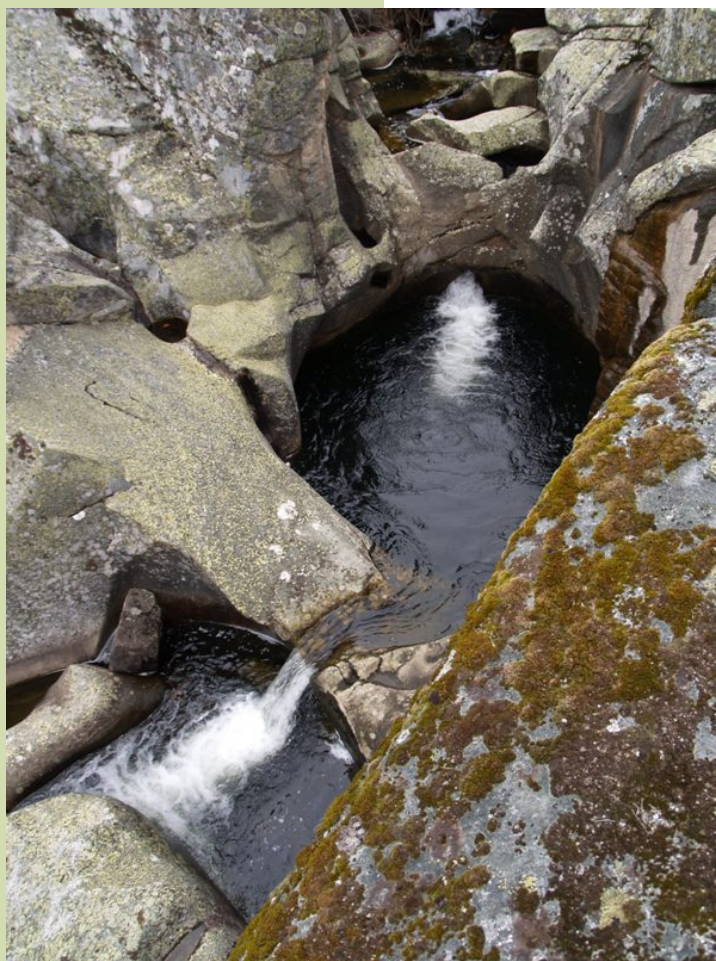
O Bibei na entrada de Pradorramisquedo excavou un pequeno canón e pozas na pedra de gran.