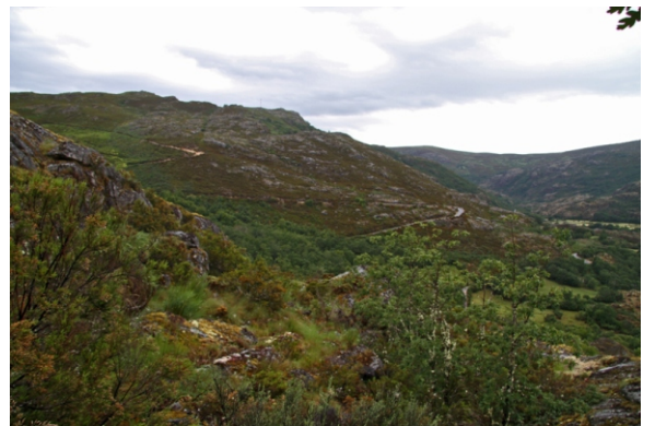
O Cabezo Grande desde a estrada de Porto.