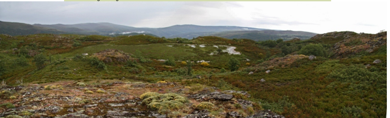
Lagoa da Moza, a máis grande do conxunto.