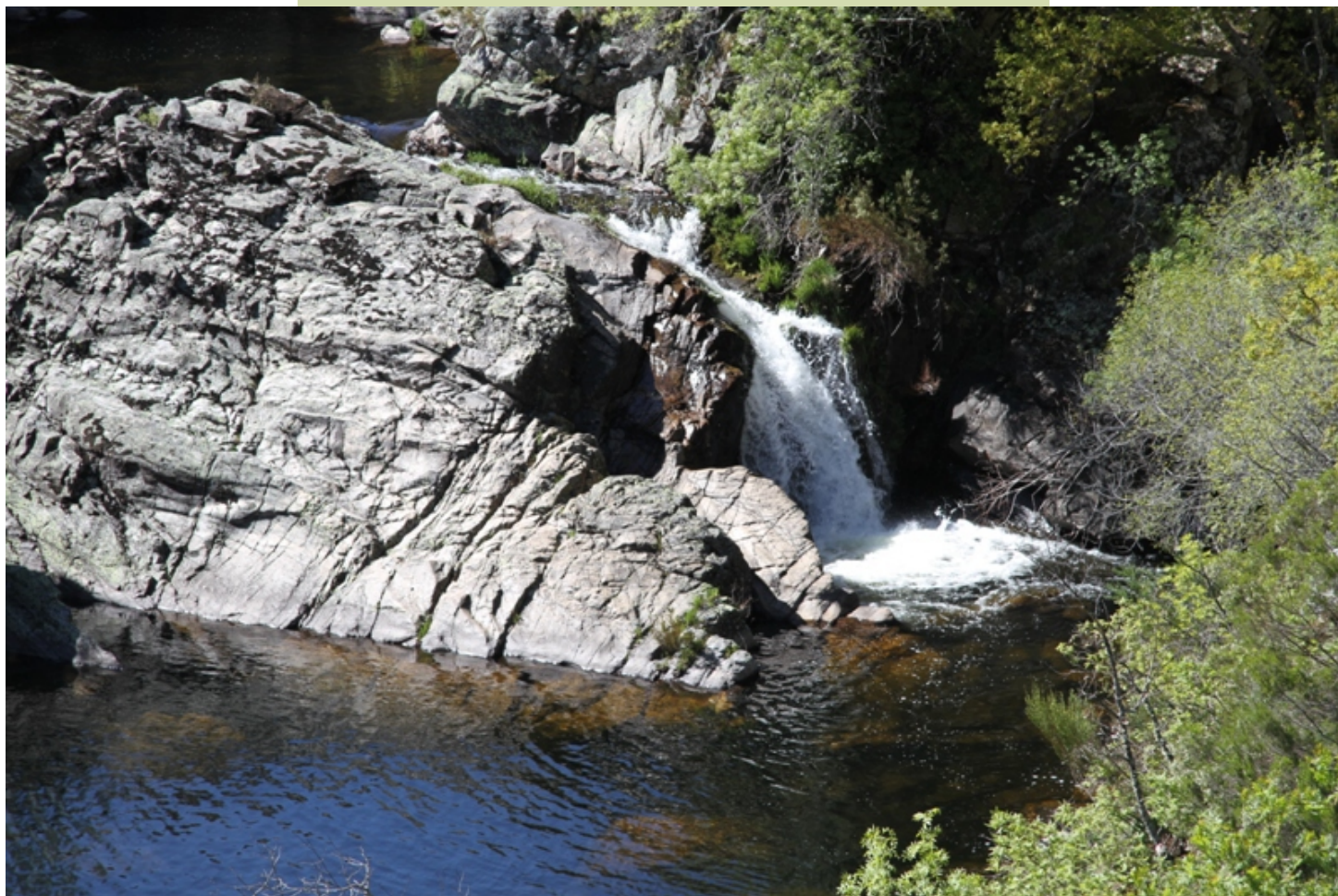
Fervenza no Bibei, á entrada de Pradorramisquedo.