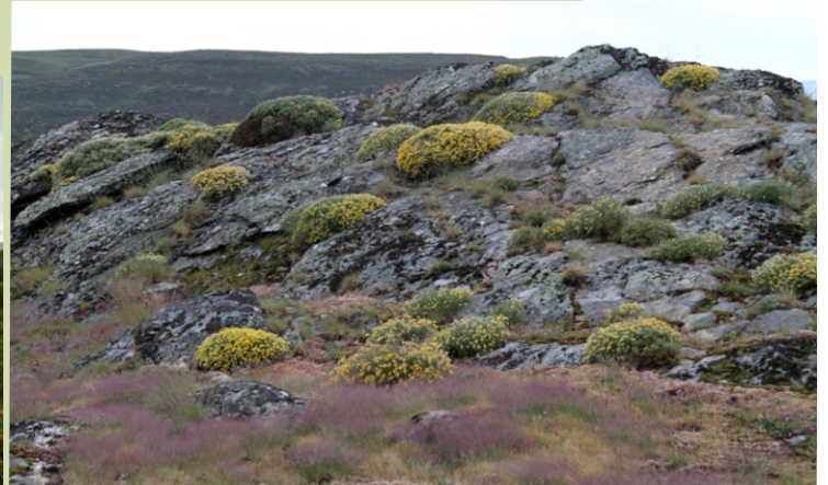
Sobre os neis dos cumes destacan as formas redondeadas dos matos de Echinopartum ibericum , unha adaptación ás condicións de vida da montaña.