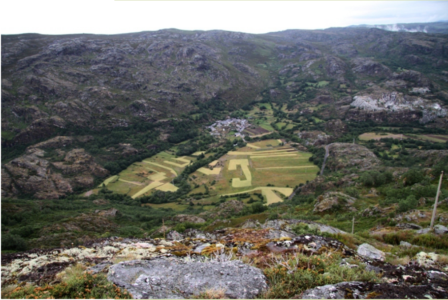
Pradorramisquedo desde o alto do Cabezo Grande